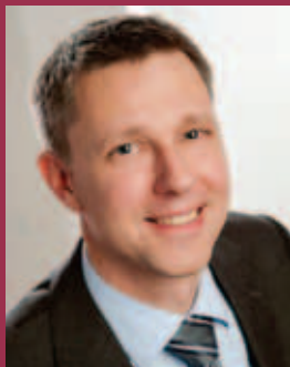
Hummel-Post-Leser: Rödental's Bürgermeister Marco Steiner