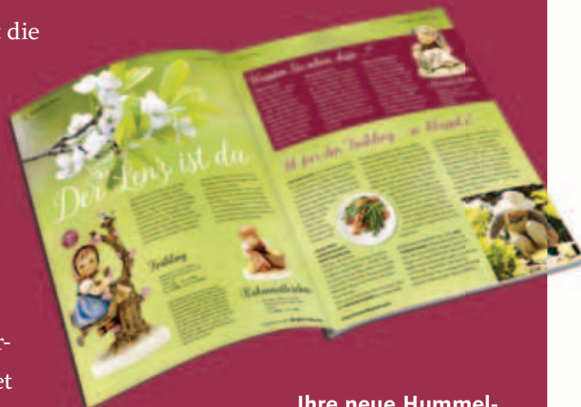
Ihre neue Hummel-Post: Frühling

erklärte er. Am 17. März öffnet die Manufaktur ihre Pforten für die Öffentlichkeit. Zum „Tag der offenen Tür“ wird der Bürgermeister um elf Uhr die Antrittsrede halten, auch in der aktuellen Hummel-Post ist er mit einem Grußwort vertreten. Das Oberhaupt der Stadt Rödental findet das Magazin, das in Hochglanz und Farbe und vielen spannenden Inhalten daherkommt, sehr gelungen.