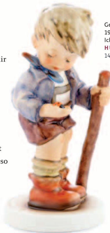
Gerhard Skrobek 1980 Ich tu Dir nix! HUM 428 14 cm 279 €

Die Hummel Manufaktur hat zu Ehren von Gerhard Skrobek ihr Archiv geöffnet und als erste Figur einer speziellen ▶